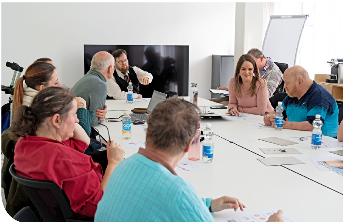
Die verschiedenen Varianten wurden miteinander verglichen und genau überprüft.