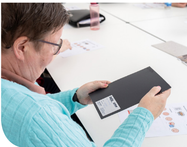
Neben der Farbe war es auch wichtig, dass der Boden pflegeleicht ist.

den weiteren Verlauf informiert. In einem späteren Meeting ging es an die konkrete Umsetzung und der Bewohnerrat entschied sich gemeinsam mit dem Projektteam für die passendste Farbe des Bodens. Nun dürfen alle gespannt sein, wie die Bodenauswahl in der fertig gebauten Passerelle aussieht. Diese sollte voraussichtlich im Frühsommer realisiert sein und wird die Zusammenarbeit zwischen den Wohngruppen vereinfachen.