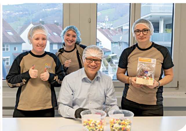
Die Mitarbeiter*innen freuten sich über die Unterstützung des Regierungsrates.