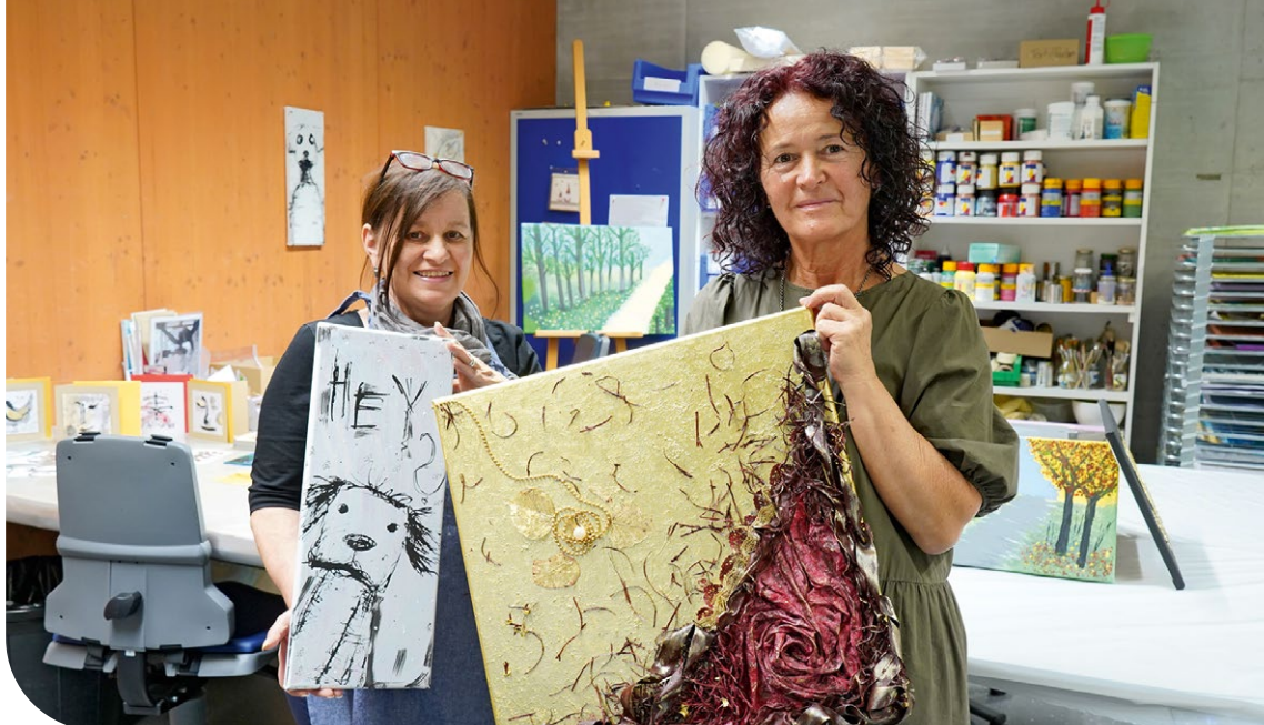
Moni und Milka präsentieren ihre aktuellen Lieblingsbilder.