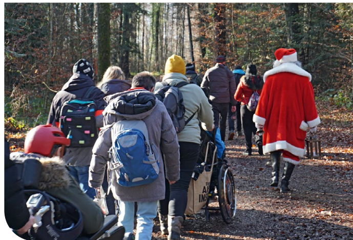
Dank Spenden ist der beliebte Ausflug mit dem Samichlausbus möglich.

4K AG, Schenkön; Aafag AG, Kleinandelfingen; ag möbelfabrik horgenglarus, Glarus; Andermatt Biocontrol Suisse AG, Grossdietwil; Arktis BioPharma Schweiz AG, Einsiedeln; Bezirkskanzlei Einsiedeln, Einsiedeln; Brauerei Rosengarten AG, Einsiedeln; Coop Genossenschaft, Schafisheim; Diethelm Aufzüge AG, Lachen SZ; Electrolux Professional AG, Sursee; Embru-Werke AG, Rüti ZH; Gemeindeverwaltung Ingenbohl, Brunnen; Gemeinnützige Baugenossenschaft, Zürich; Genossenschaft Migros Luzern, Ebikon; GIPO GISLER POWER AG, Seedorf UR; GIRA-SOLE GmbH, Ziegelbrücke; Gübelin AG, Luzern; Hochbauamt Kanton Schwyz, Rickenbach b. Schwyz; Huggyclub, Galgenen; Informationsstelle AHV/IV, Zürich; Jungheinrich AG, Hirschthal; KAGO AG, Goldau; Kita Zauberbrunnen, Brunnen; KKS Ultraschall AG, Steinen; KST AG, Einsiedeln; KURTS GmbH, Rapperswil SG; Lienert-Kerzen AG, Einsiedeln; Lindner Suisse GmbH, Wattwil; Linthmais AG, Schübelbach; liora design GmbH, Lachen SZ; Mecana AG, Reichenburg; Minz, Agentur für visuelle Kommunikation, Luzern; Mobil in Time AG, Diessenhofen; Murghof Werkstätten, Frauenfeld; Nord-Lock AG, St. Gallenkappel; Novasina AG, Lachen SZ; Pamasol Willi