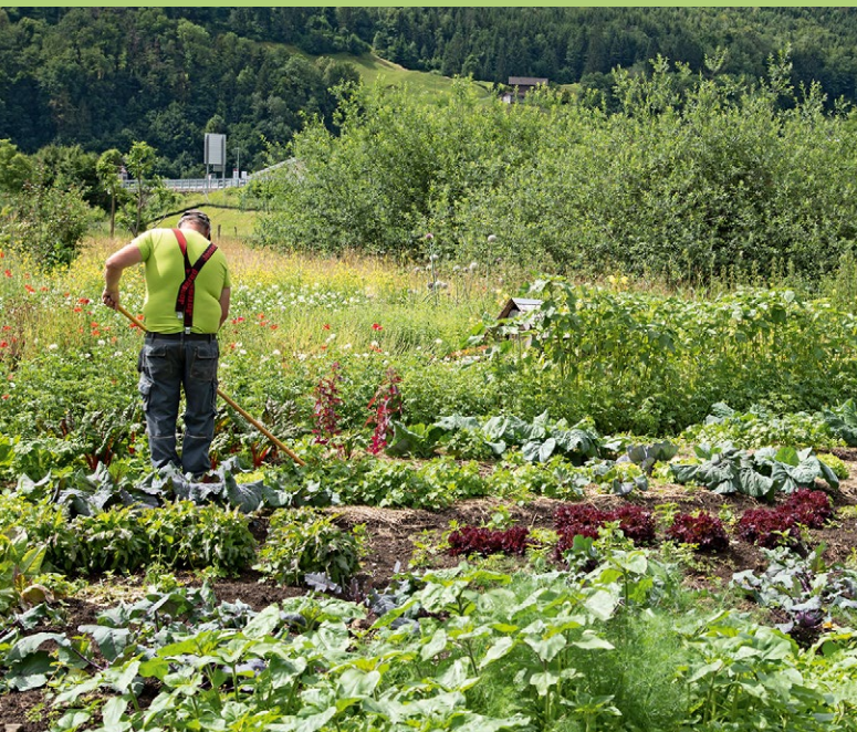
Eine vielfältige Bepflanzung bietet Nahrung und Lebensräume und fördert die Biodiversität.

Damit die tiergestützte Intervention auch für Mitarbeitende im Rollstuhl angeboten werden kann, wurden ausserdem die Untergründe bei den Tierausläufen befestigt und die Eingänge zu den Tiergehegen verbreitert. Mit dem neuen Maschinenunterstand neben dem Stallgebäude für die Gerätschaften konnte mehr Ordnung sowie zusätzliche Möglichkeiten für Arbeiten unter dem Dach geschaffen werden. Für eine erhöhte Sicherheit vor Ort wurden die Parkplätze entlang der Zufahrtsstrasse weiter vorne zur Einfahrt verlegt.