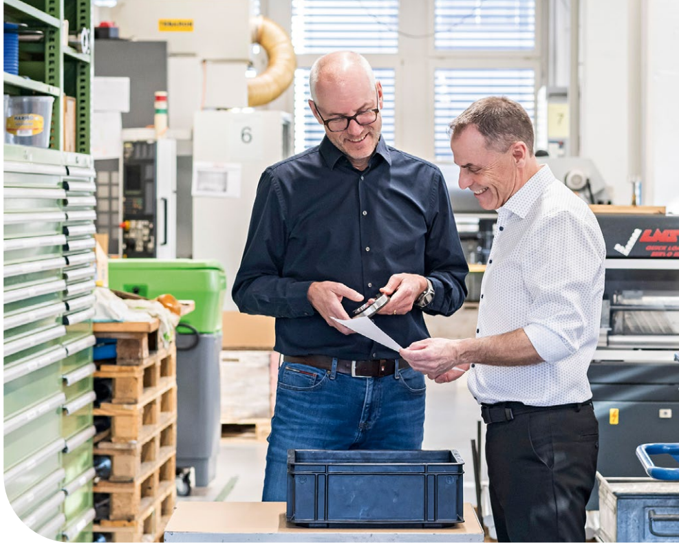
Kundenaufträge bieten wichtige Teilhabemöglichkeiten im Arbeitsprozess.

regieüberarbeitung strukturiert und nachvollziehbar gestaltet war. Zudem sollte der Inhalt so dokumentiert werden, dass eine gute Grundlage für die Umsetzung und die anschließende Kommunikation gegeben ist.